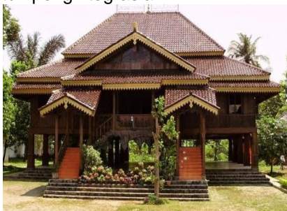
Gambar 1. Rumah Adat Lampung

Materi: Definisi Himpunan Bentuk pengintegrasian: