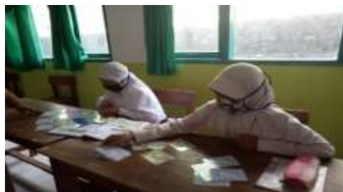
Gambar 4. Penggunaan Tuan Ratu Pede dalam pembelajaran

Guru melakukan pengamatan aktifitas dan sikap yang ditunjukkan oleh peserta didik dalam proses pembelajaran, melakukan tes hasil belajar sesuai dengan pedoman dan rencana, dan memonitoring dampak penggunaan Tuan Ratu Pede berupa hasil belajar siswa menggunakan soal tes objektif.