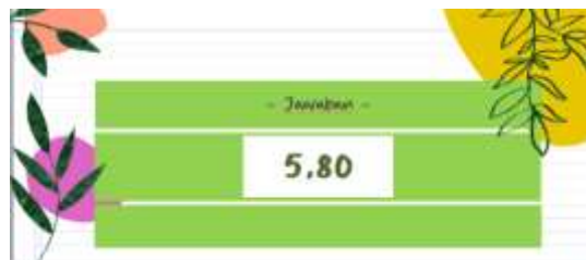
Gambar 2. Draft Kartu Jawaban Tuan Ratu Pede

belajar terkait bilangan desimal. Visualisasi dari kartu jawaban Tuan Ratu Pede dapat dilihat pada gambar 2 berikut ini.