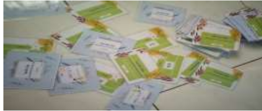
Gambar 3. Media Tuan Ratu Pede yang digunakan dalam pembelajaran

mengutamakan jaga jarak dan durasi pembelajaran kurang dari dua jam.