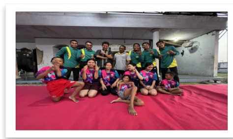
Gambar 2. Strategi pengaplikasian gerakan teknik dasar roll depan dan roll belakang pada senam lantai yang benar kepada atlet pemula